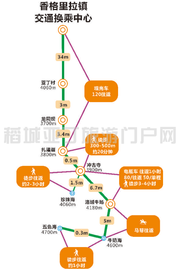
景区内线路示意图