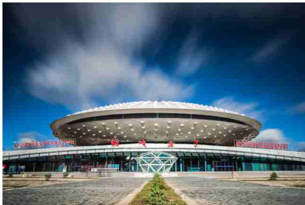
稻城亚丁机场目前已开通航班城市图

稻城亚丁机场海拔4411米，超过了海拔4334米的西藏昌都机场而成为世界上海拔最高的民用机场。机场坐落在有“月球表面”的海子山上，机场的航站楼外形酷似“飞碟”，如果你攀上附近的山坡，俯瞰整个机场，你会看见乱石迭起的海子山表面上，“飞碟”状的候机楼静默而立，远处群山连绵起伏，一片片草甸里牦牛安静地巡游，蓝天下微风吹拂着荒草丛丛，仿佛置身于外太空电影中的场景。